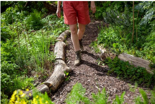
Voorbeeld van een kronkelpaadje