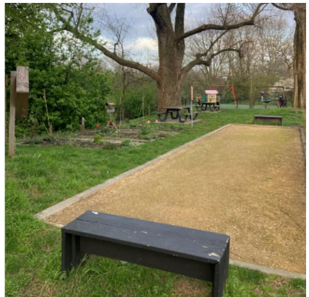
Voorbeeld van een jeu de boulesbaan, bijenhotel en bloemenperkje met hoge bomen